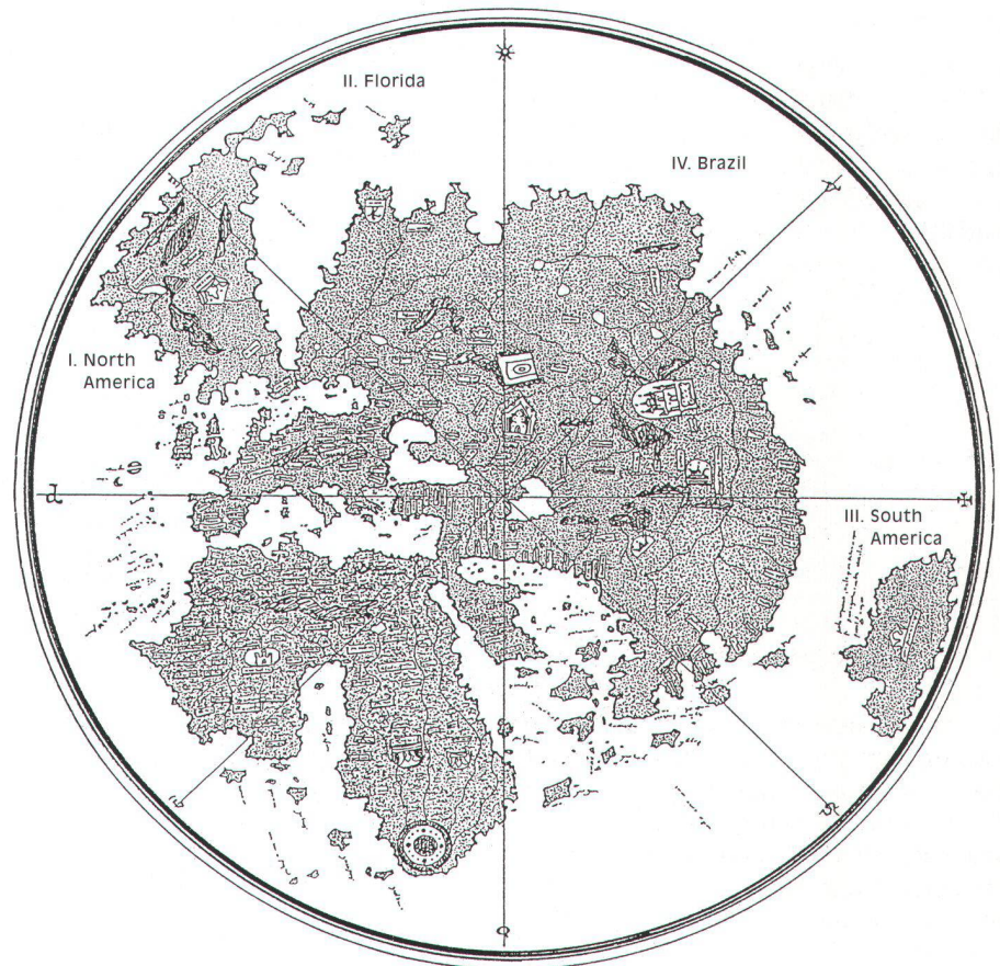
Abb. 3: Gunnar Thompson: Die Weltkarte des Albertin de Virga in neuer geographischer Deutung. Originaltitel: America's Oldest Map - Albertin De Virga, Venice, 1414 AD . Die modernen geographischen Zuordnungen sind durch ein Copyright Thompsons geschützt. © 1995.

Die Weltkarte Albertin de Virgas von 1411/1415 verblüfft dadurch, dass sich ihr