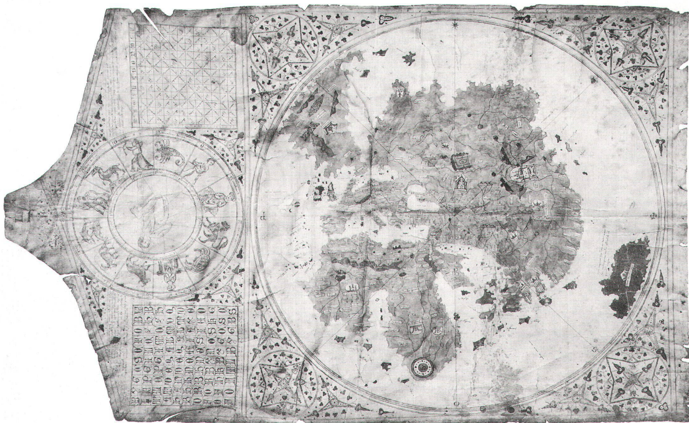
Abb. 1: Albertin de Virga: Weltkarte von 1411 oder 1415. Gesamtansicht mit dem Kalenderteil (links) und der Weltkarte (rechts). Der Kalenderteil gliedert sich (von oben nach unten) in die «Mondtafel», den kreisförmigen Zo-

diakal-Kalender und die Tafel zur Bestimmung der Osterdaten. Pergament, 69,6 x 44 cm. Kolorierte Federzeichnung. Reproduziert nach der Abbildung im Versteigerungskatalog von Gilhofer und Ranschburg, Luzern 1932.