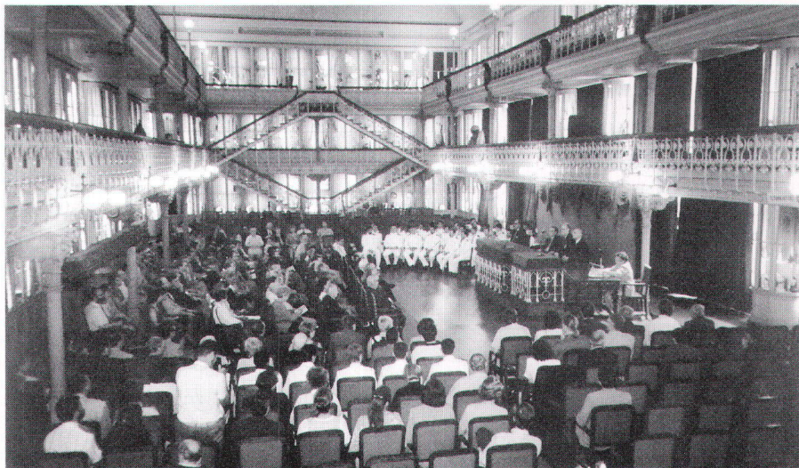
Eröffnungszeremonie in der Geographischen Gesellschaft von Lissabon (Photo: Ivan Kupčik).