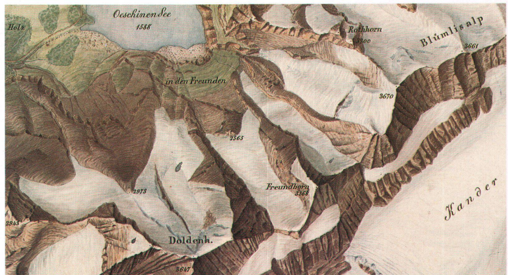
Partie des Berner Oberlandes 1:50 000, Originalzeichnung von Johann Rudolf Stengel, 1850.