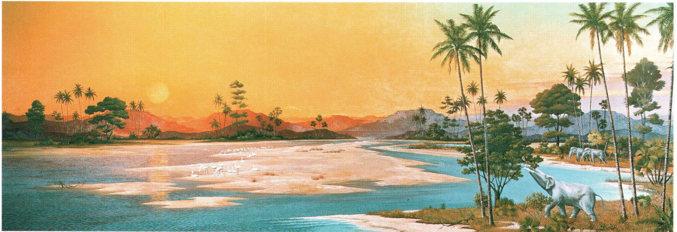
Luzern vor 20 Millionen Jahren (Miozän, Tertiär)

strand vor 20 Millionen Jahren bis zur kalten Gletscherwelt der Eiszeit vor 20 000 Jahren.