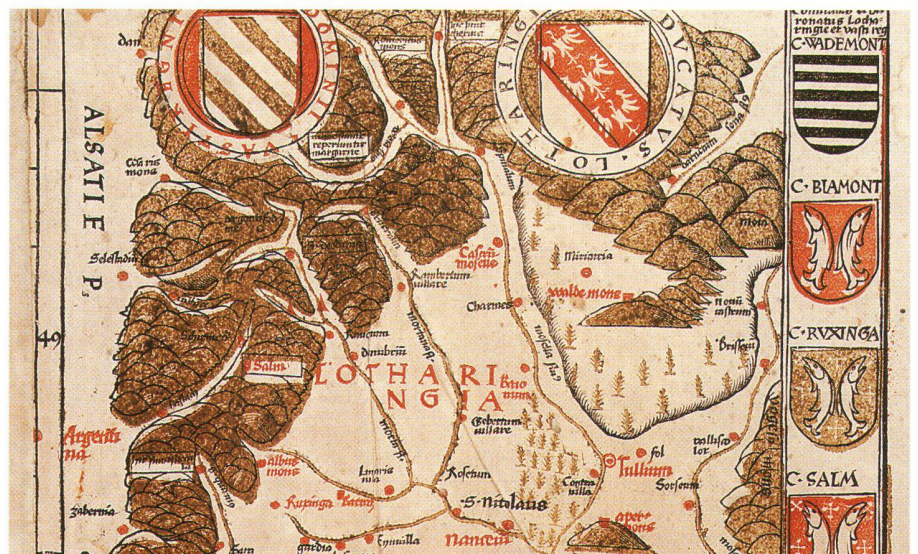
Abb. 3: Vergrößerter Ausschnitt aus einem schlecht passenden Druck der dreifarbigigen Lothringenkarte aus dem Ptolemaeus-Atlas von Martin Waldseemüller (Strassburg, 1513) (Zürich, Zentralbibliothek, VZZ 19 p).