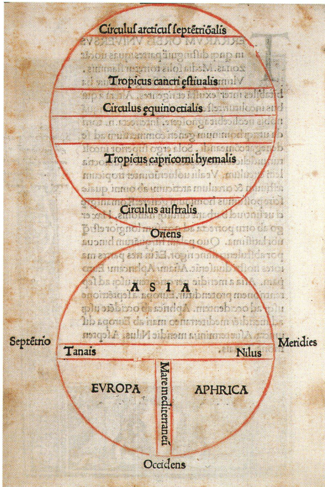
Abb. 5: Die T-O-Weltkarte von Zaccaria Lilio, gedruckt von Antonio Bartolommeo Miscomini (Florenz, 1493) gilt als die erste zweifarbig gedruckte Karte (London, British Library Map Library, IA 27207).