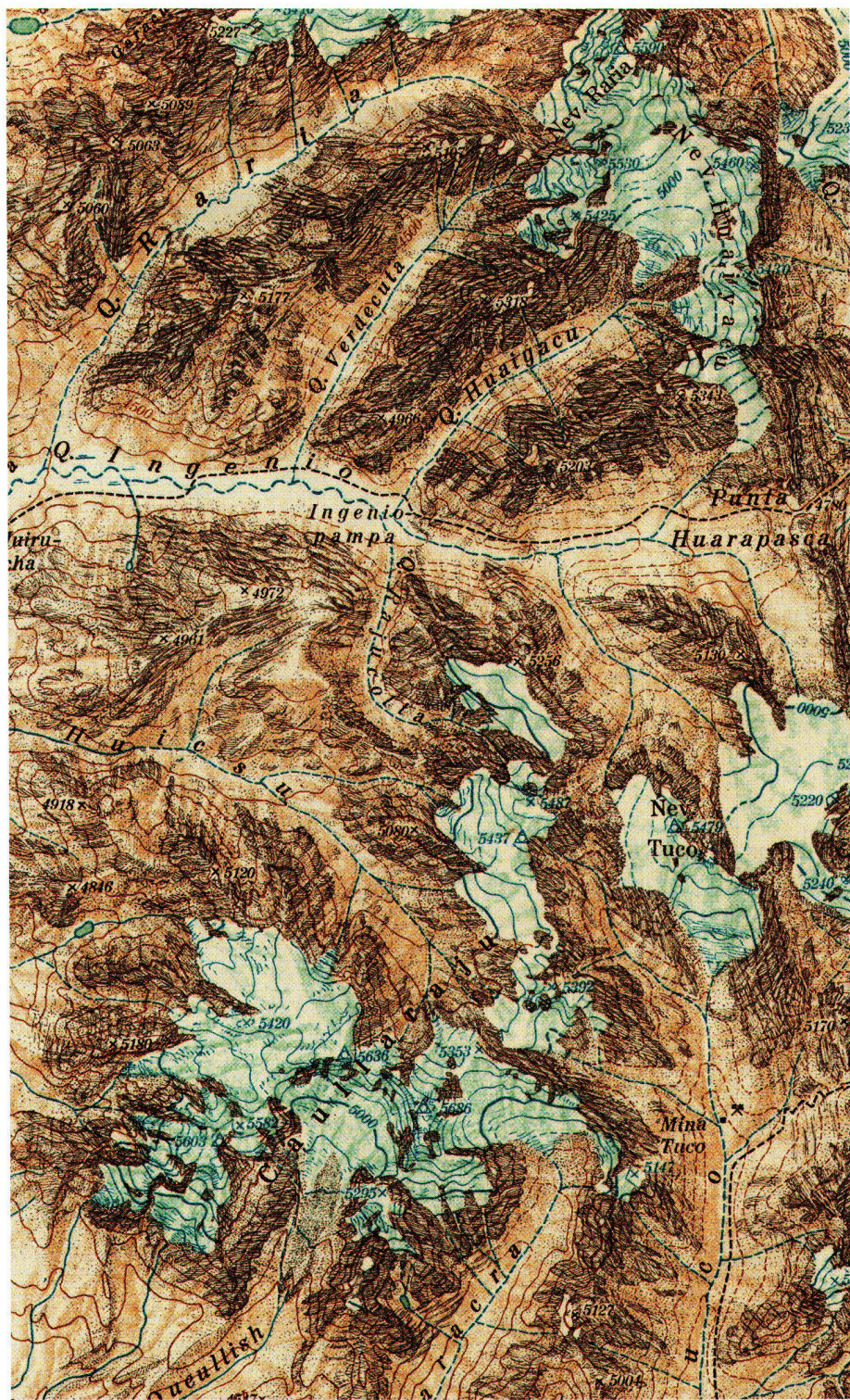
Abb. 4: Karte der Cordillera Blanca (Perú), Südteil, 1:100 000, 1945. Ausschnitt in Originalgrösse.

Mai bis August 1939 ein rund 5000 km 2 grosses Gebiet durch Triangulation (mit Anschluss an die peruanische Landesvermessung) und photogrammetrische Aufnahmen ziemlich lückenlos. Nachdem aber der Ausbruch des Krieges in Europa eine Rückkehr über den Atlantischen Ozean unmöglich machte, konnten die Expeditionsteilnehmer erst nach langen Umwegen über Japan und Sibirien 1941, kurz vor Ausbruch des Zweiten Weltkrieges gegen Russland, nach Österreich zurückkehren. Die Spiegelglasplatten der photogrammetrischen Aufnahmen mussten aber zurückgelassen werden. Gerettet wurden damals Papierabzüge der Messbilder, der Grossteil der sonstigen photogra-