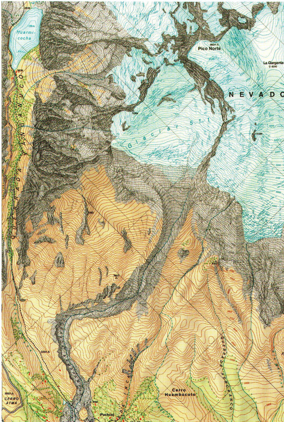
Abb. 6: Karte des Nevado Huascarán, Cordillera Blanca, Perú, 1:25000, 1967. Ausschnitt verkleinert auf 50 %.

fast vollständig zerstörte, gab schliesslich 1964 Anlass für ergänzende grossmassstäbige photogrammetrische Aufnahmen durch Erwin Schneider und Franz Elmiger. 37 Die Auswertung vervollständigte einerseits die Ergebnisse von Walther Hofmann aus 1954 und erbrachte die Karte Nevado Huascarán, Cordillera Blanca, Perú (1:25000, Neunfarben-Offsetdruck, 1967) (Abb. 6), andererseits entstand das Blatt Nevado Huascarán, Cordillera Blanca, Perú, Gletschersturz-Mure vom 10. Jänner 1962 (1:15000, Neunfarben-Offsetdruck, 1967). Beide im Rahmen der Alpenvereinskartographie in Innsbruck von Fritz Ebster kartographisch gestalteten Blätter zeigen Abrisswand, Sturzbahn und Ablagerungsgebiet der Mure und das Ausmass der Verwüstungen im Santa-Tal, durch die 4000 Menschen den Tod fanden. Noch waren aber die Aufbauarbeiten nicht abgeschlossen, als Nordperu am 31. Mai