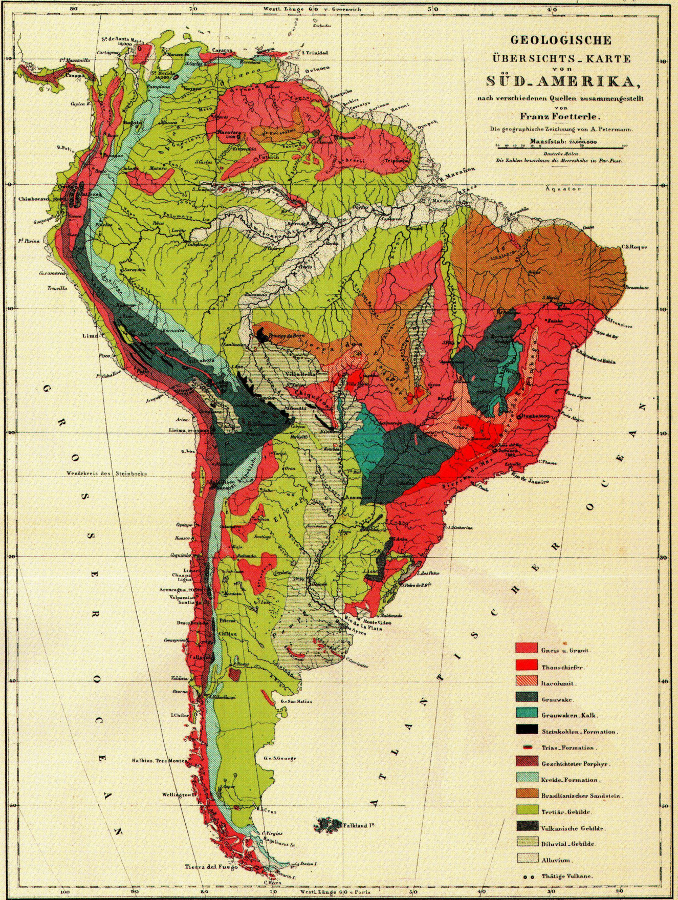
Abb. 1: Geologische Übersichts-Karte von Südamerika, nach verschiedenen Quellen zusammengestellt von Franz Foetterle. Zeichnung von August Petermann, Justus Perthes Verlag, Gotha 1856. Abb. verkleinert auf 75 % (alle Abbildungen aus der Kartensammlung der Zentralbibliothek Zürich).