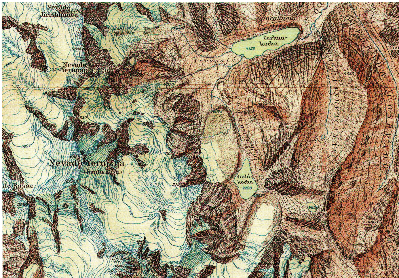
Abb. 3: Karte der Cordillera de Huayhuash (Peru), 1:50000, 1939. Ausschnitt in Originalgrösse. (Vgl. Abb. 2).

von Naturkatastrophen rasch Praxisnähe erlangte.