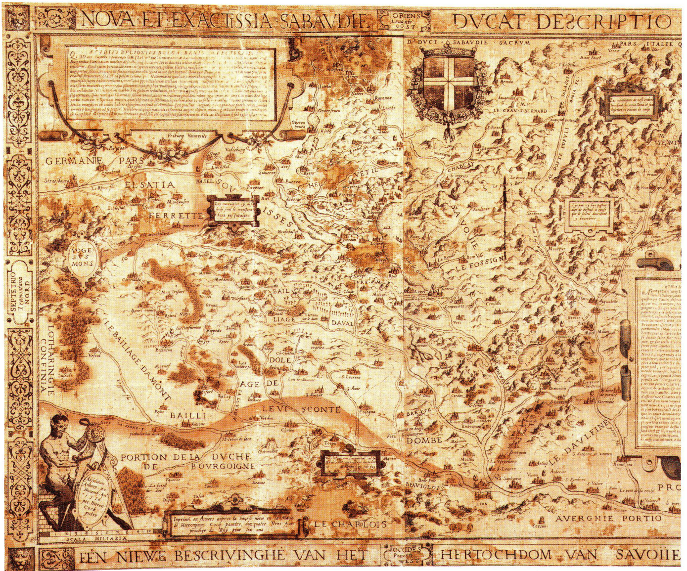
Abb. 7: Gilles Boileau de Bouillon: Nova et exactissima Sabaudiae ducatus descriptio [Neue und genaueste Beschreibung des Herzogtums Savoyen]. Ostorientierte Kupferstichkarte, herausgegeben 1556 bei Hieronymus Cock in Antwerpen. Kartenformat: 60 x 40 cm, verkleinert auf ca. 40%. Der besseren Lesbarkeit wegen ist hier nur ein Teil der Karte abgebildet. (Herzog August Bibliothek, Wolfenbüttel).

turen und Ergänzungen. Mit ihr und an ihr arbeitete er weiter. Das Einzelblatt dagegen erfuhr keinerlei Veränderungen mehr, erhielt keine Addenda, sichtlich weil es durch den Neuauszug obsolet geworden war.