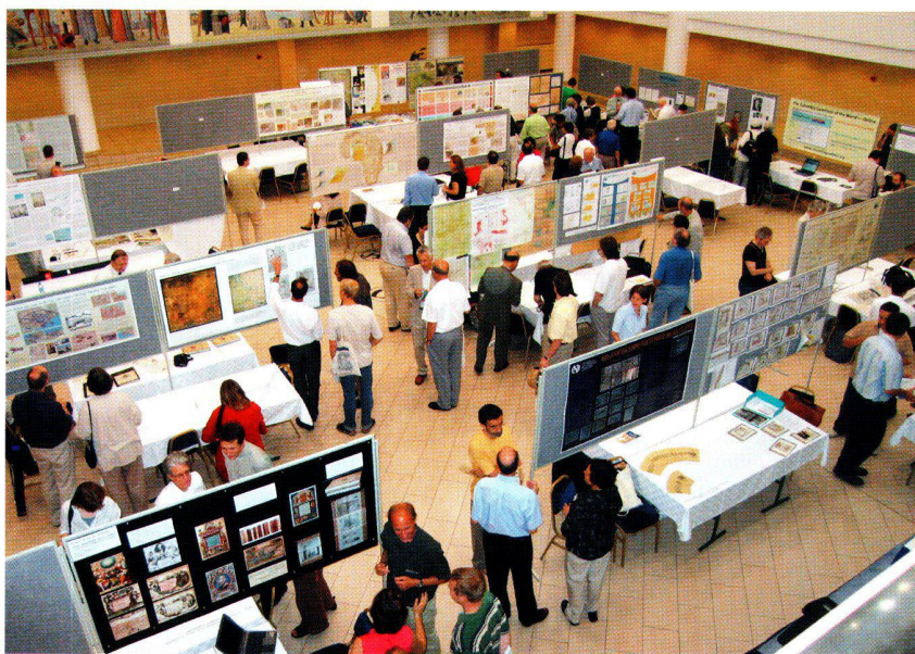
Teil der Posterausstellung der 21. Internationalen Konferenz zur Geschichte der Kartographie in Budapest.

Boundaries and Resource Rights: Cartography of US Appalachian Lumber, Coal & Mining Rights.