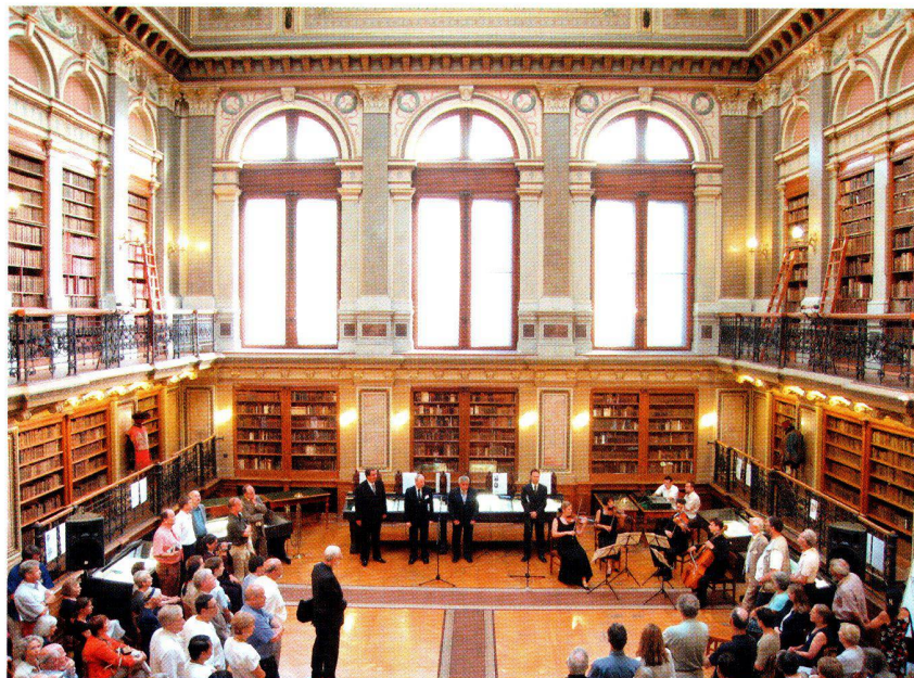
Musikalische Umrahmung zur Eröffnung der Kartenausstellung in der Eötvös Loránd Universitätsbibliothek in Budapest.