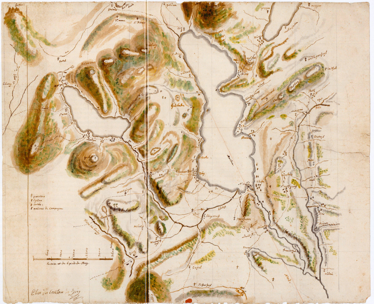
Abb. 2: Plan du Canton de Zug von Franz Ludwig Pflyler, ca. 1780. Aquarellzeichnung, südorientiert. Format: 55 x 45 cm (Privatbesitz).