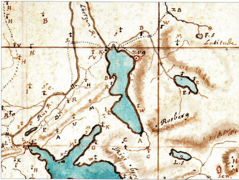
Abb. 3: Ausschnitt aus der Carte originale du Général Pfyffer , um 1770. Aquarellzeichnung, ca. 1:245000, nordorientiert. Die in der Karte abgekürzten Ortsnamen sind – hier nicht abgebildet – rechts neben dem Kartenbild in einer alphabetisch geordneten Liste vollständig aufgeführt. Abbildung 1:1 (Gletschergarten, Luzern).