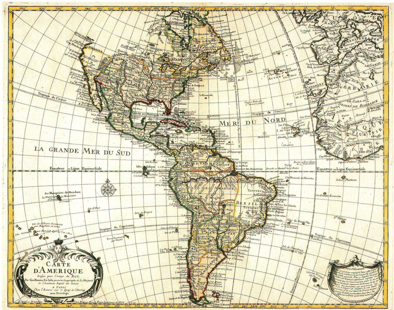
Abb. 2: Nord-Ost-Ausschnitt der Amerikakarte von Guillaume Delisle (1722) mit dem über Ferro verlaufenden Ausgangsmeridian und Paris auf 20° Ost.

hannes Kepler stellte schon 1627 in den Tabulae Rudolphinae die Längenverhältnisse zwischen Lissabon und Budapest weitgehend fehlerfrei dar, erreichte jedoch am Ost-Ende des Mittelmeeres wieder den alten Fehler Gerhard Mercators von etwa 10°. Die nächste durchgreifende Verbesserung erfolgte gegen Ende des 17. Jahrhunderts, vor allem auf Initiative der königlichen Akademie der Wissenschaften in Paris. Sie veranlasste Expeditionen zur wissenschaftlichen Längenbestimmung von damals schwer zugänglichen Orten im östlichen und südlichen Mittelmeergebiet und auf den Inseln Ferro (Kanaren) und Gore (am Kap Verde) im Atlantik. Damit war das Grundgerüst der europäischen Längenwerte auf eine sichere Basis gestellt. Auf Karten treten allerdings die alten Werte, wahrscheinlich bedingt durch kommerzielle Überlegungen, noch lange auf. Die in dieser Arbeit erstellten Fehlerverlaufskurven sind für verschiedene Gruppen von Kartographen beziehungsweise von Kartenverlagen charakteristisch. Sie lassen die Weiterverwendung alter Kupferplatten noch um die Mitte des 18. Jahrhunderts erkennen, auch wenn in denselben Atlanten bereits wesentlich verbesserte Karten mit eingebunden wurden.