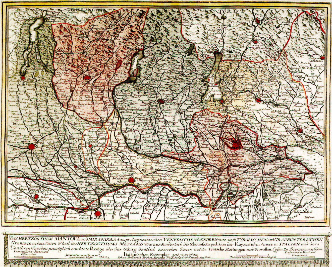
Abb. 6: Die Karte des Herzogtums Mantua und Mirandola wurde ursprünglich von Michael Kauffer gestochen und herausgegeben. Von Johann Friedrich Probsts Ausgabe gibt es zwei Versionen, die sich darin unterscheiden, dass der auf eine eigene Druckplatte gestochene Titel entweder oberhalb oder unterhalb der Karte angebracht wurde (UB Bern, ZB, Ryh 3402:48).

Probst aus. In Dankbarkeit möchte ich ihm diesen Beitrag widmen, der unsere gemeinsamen Erkenntnisse zu diesen beiden Verlagshäusern zusammenfasst.