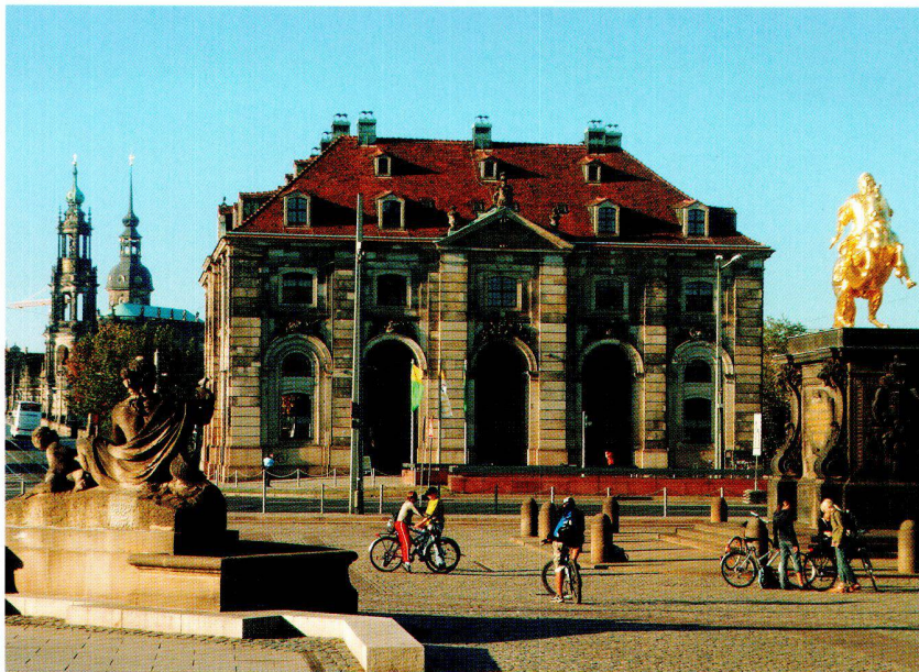
Das 13. Kartographiehistorische Colloquium fand im sogenannten Blockhaus, der ehemaligen Neustädter Wache in Dresden statt (Photo: H. U. Feldmann).