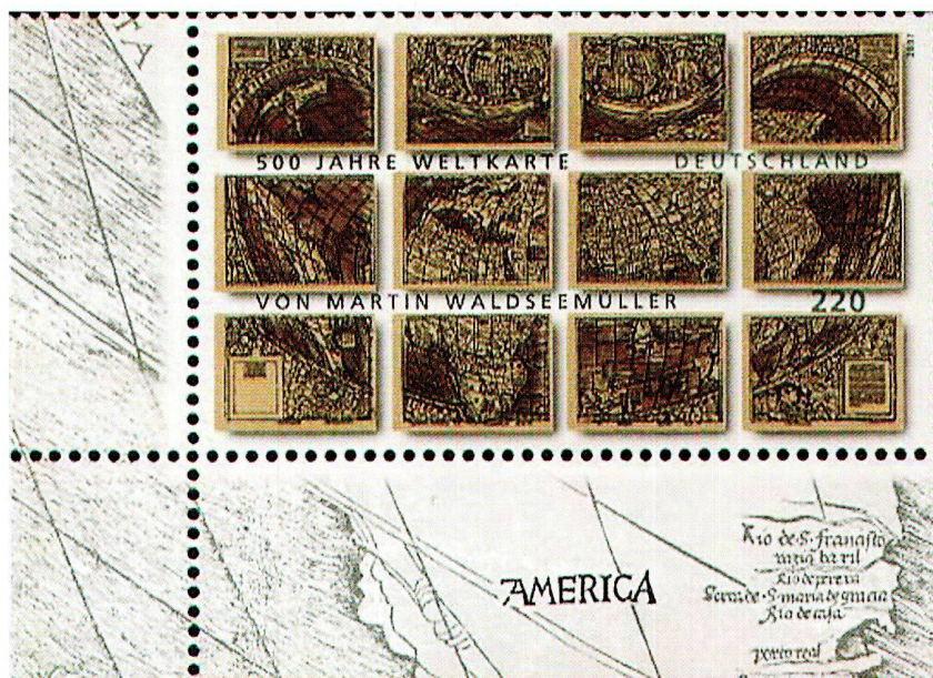
Sonderbriefmarke «500 Jahre Weltkarte von Martin Waldseemüller» (Deutschland E 2.20).

Die Exposition philatelique des motifs wird seit 1959 alljährlich im luxemburgischen Bad Mondorf organisiert. Der