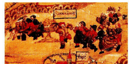
Abb. 1: Situationsdarstellung eines Unfallgeschehens am 5. Dezember 1562 im Gelände bei Oberbergen (bei Landsberg am Lech). (BayHStA München, Pls. 20607; aus: Kurbayern AA 26, fol. 124).

Die Dissertation behandelt in einer ausführlichen kartographiehistorischen Stu-