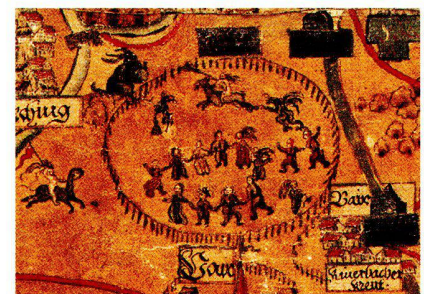
Abb. 2: Darstellung eines Hexentanzes beziehungsweise einer ländlichen Festszene. Ausschnitte aus der Prunkkarte der Grafschaft Graisbach (bei Donauwörth) von 1570. (BayHStA, Pls. 4269).