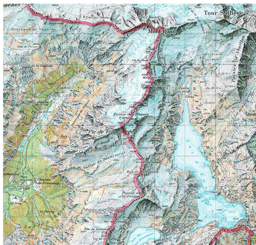
Abb. 2: Landkarte 1:50 000, Blatt 272 Martigny (Stand 2001) mit dem heutigen Grenzverlauf und dem Stausee von Emosson. Beide Kartenausschnitte auf ca. 65% verkleinert.