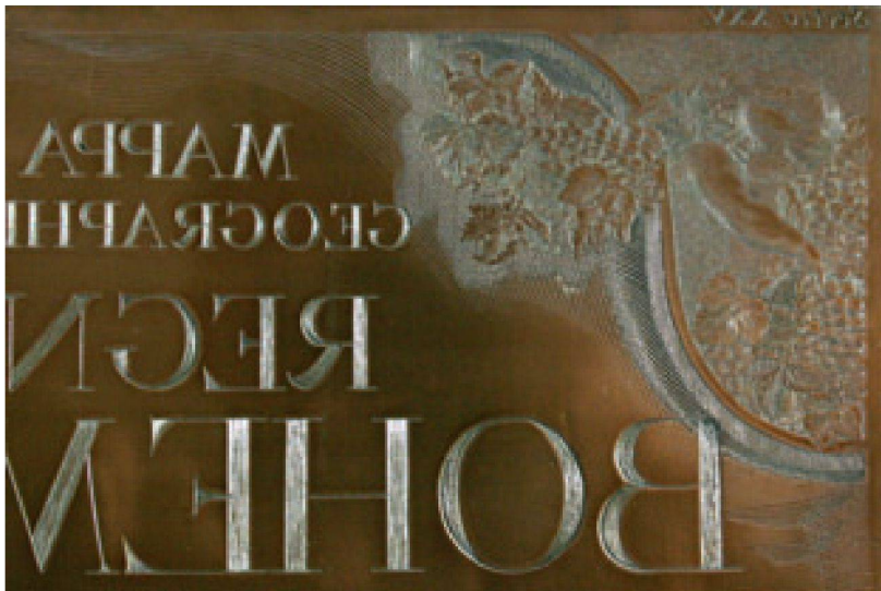
Abb. 5: Detail der Titeltartusche auf der Kupferplatte der Mappa Geographica Regni Bohemiae [...] von Michael Kauffer, 1722 (Vgl. Abb. 7) (Praha, Národní technické muzeum / Sign. 1852).