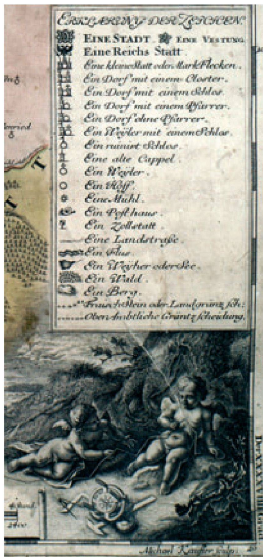
Abb.3: Zeichenerklärung der «grossen Ausgabe» der Ansbach-Karte Tabula Geographica Nova [...], gestochen von Michael Kauffer, 1719 (Staatliche Bibliothek Ansbach/XIV f 296).