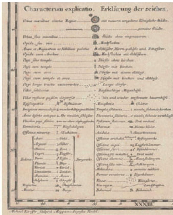
Abb. 6: Ausschnitt aus der Zeichenerklärung der Mappa Geographica Regni Bohemiae [...] von Michael Kauffer, 1722 (Brno, Moravská zemská knihovna / Sign. Moll-0090.900,AA.T.XX,40-64).