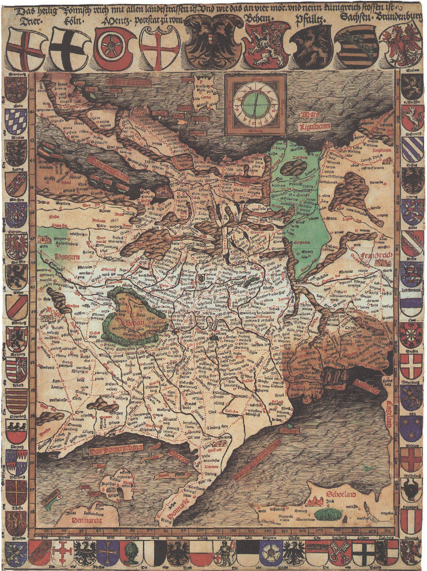
Abb.2: Die erste Germania-Karte Georg Erlingers von 1515, Format: 44,5 x 60 cm (aus: Meurer, Germania-Karten, Tafel 2–6).