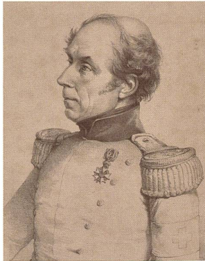
Chef des Topographischen Bureaus