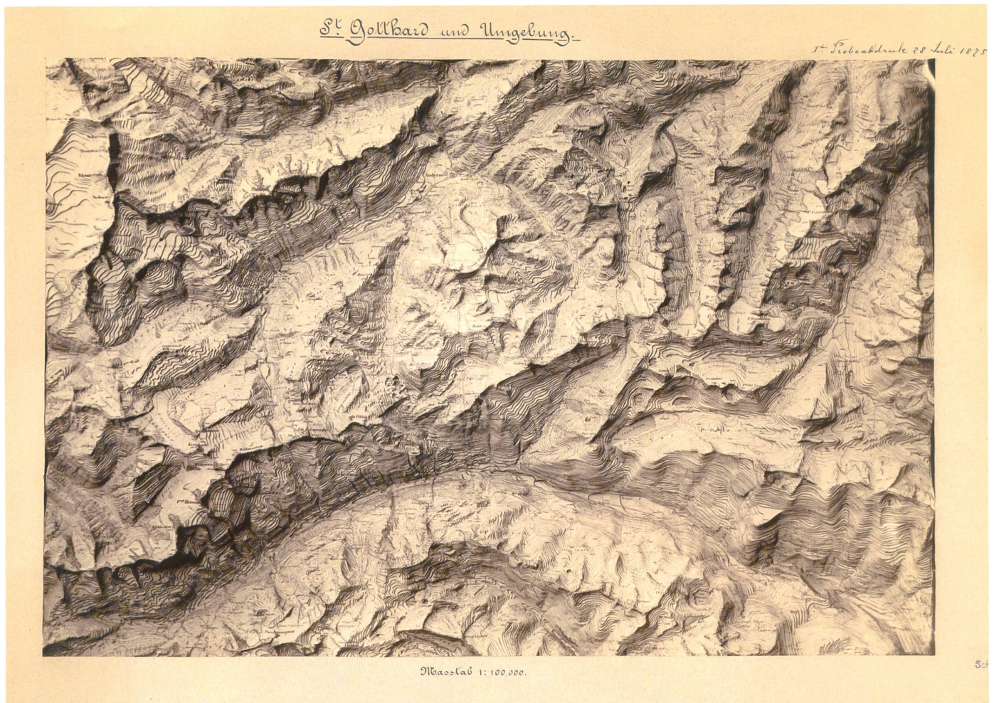
Abb. 6: Photo des Reliefs St. Gotthard und Umgebung . 1r Probeabdruck 28. Juli 1875. Dieses verschollene sogenannte «Carte-Relief» von Ingenieur Philipp Gosset wurde auf der Grundlage von vier Blättern des Topographischen Atlas der Schweiz 1:50 000 erstellt, von Nordwesten her künstlich beleuchtet und vermutlich durch Emil Nicola-Karlen als photographische Reliefstudie in den Massstab 1:100 000 reduziert. Abb. auf ca. 25% verkleinert.

sind gut [...]. Ich möchte demnach die Versuche einstweilen noch nicht einstellen aus dem Grunde dass wenn sie schliesslich doch gelingen sollten das Resultat des Verkaufs der Abdrücke [...] dem Stabsbureau eine kleine Einnahmequelle verschaffen würde. [...] Wenn also die bisherigen Versuche die ph[otographisch reproduzierte] Karte in Sectionen zusammenzustellen für den Verkauf scheitern sollten, so wäre es möglich die Karte auf einem Cliché in Wien in 1:500000 photographiren zu lassen.» 84 Das Resultat dieser Bemühungen bildet die Relief-Karte der Schweiz. Zusammengestellt und re-touchiert für die Wiener Weltausstellung 1873 (Abb. 4). Sie ist das erste Produkt des Eidgenössischen Stabsbureaus, das photographisch vervielfältigt und veröffentlicht wurde, was nur dank enger Zusammenarbeit mit Nicola-Karlen möglich war. In den Berichten über die Wiener Weltausstellung scheint es allerdings – im Gegensatz zur zusammengesetzten Dufourkarte in Originalgrösse, welche als «groses Wandtableau in voller Schönheit und Stattlichkeit» überschwänglich gerühmt wurde 85 – keine Beachtung gefunden zu haben. Umso enthusiastischer wurde es in der Berner Presse als «ein an Schärfe und Plastik wahrhaft unerreichbares Relief der Schweiz» gefeiert und «zum Preise von 10 Fr. bei allen Buch- und Kunsthandlungen» angeboten (Abb. 5). 86 Die «von Nicola in Bern photographierte Dufourkarte» wurde als eines der ersten photogra-