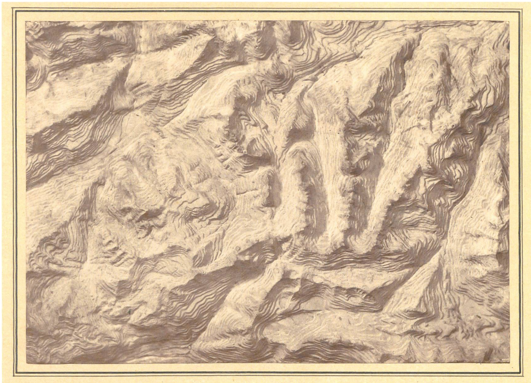
Abb. 7: Photographie von F. Gysi Aarau (Prägestempel unten Mitte), um 1873/1875. Als Grundlage wurde ein von Nordwesten her beleuchtetes Schichtstufenrelief der Gegend zwischen der Göscheneralp und Casaccia südöstlich des Lukmanierpasses verwendet. Es ist nicht identisch mit jenem, das der Abb. 6 zugrunde liegt, weil keine Karteninformation zu sehen ist. Abb. auf ca. 25% verkleinert (swisstopo, Kartensammlung).

24:35 cm bis an Rand & Ecken hinaus gleichmässig kräftig & sauber wie in der Mitte herauszubekommen. Dazu bietet mir mein grösstes Objektiv [...] nicht die volle Gewähr, dass auf obige Plattengrösse der Massstab gegen den Rand hin so correct eingehalten werde, wie im Centrum. Sodann wäre es mir unmöglich, die Arbeit in der gewünschten Zeit ungestört & sorgfältig vorzunehmen, da zur Zeit mein Atelier für Personen-Aufnahmen stark frequentirt wird.» 90 Gysis Argumente zeigen, dass bei kartographischen Rephographien die Dimensionen eine entscheidende Rolle spielten, was sein Instrumentarium nicht zu gewährleisten vermochte. Damit waren die Zusammenarbeitsversuche des Stabsbureaus mit dem damals «besten Photographen der Schweiz» 91 beendet.