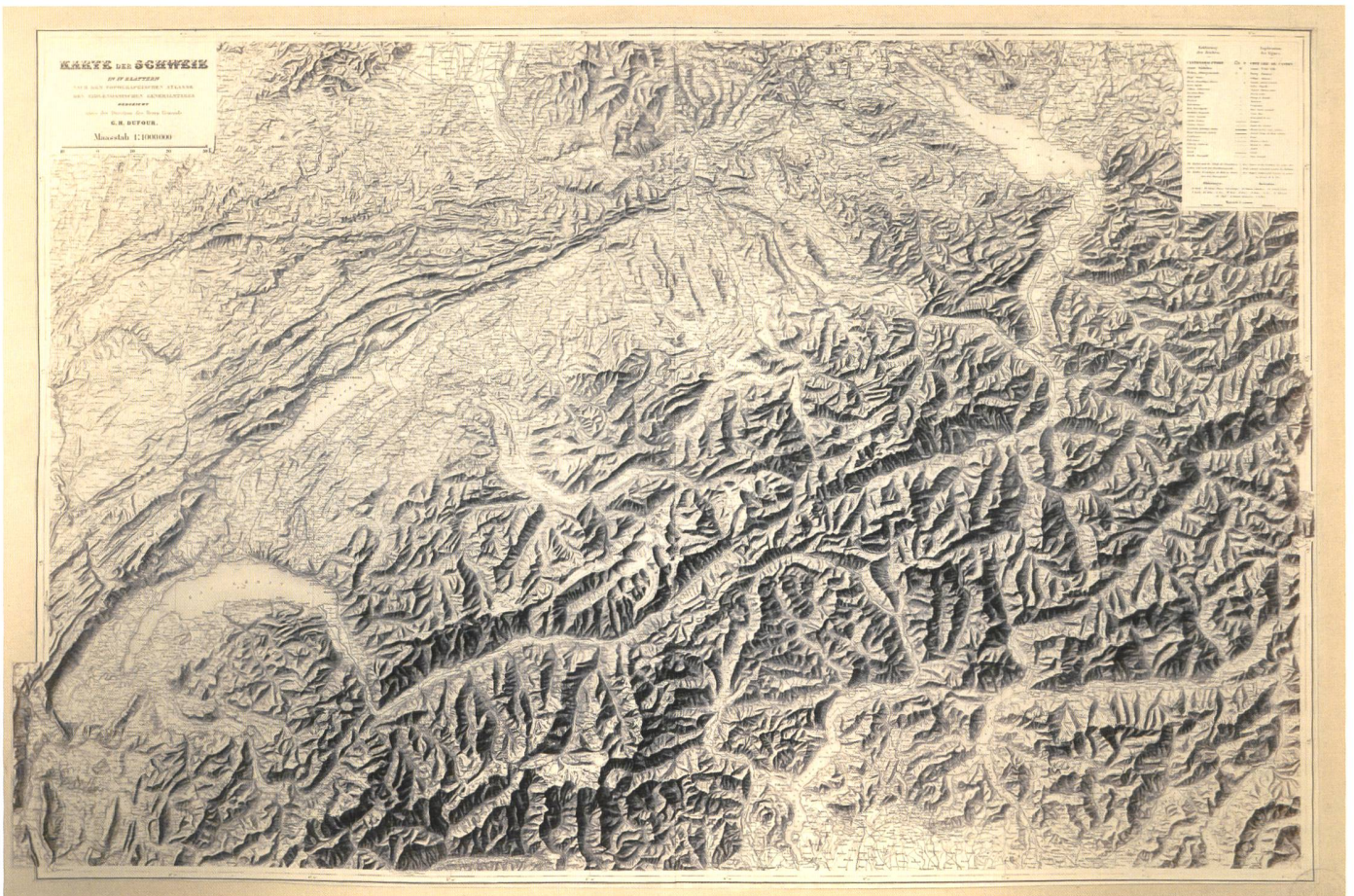
Abb.8: Karte der Schweiz in IV Blättern, auch bekannt unter dem Titel Generalkarte der Schweiz 1:250 000, 1886 in zusammengesetzter Form photographisch in den Massstab 1:1 000 000 reduziert. 37 x 24 cm, hier verkleinert auf ca. 45%.