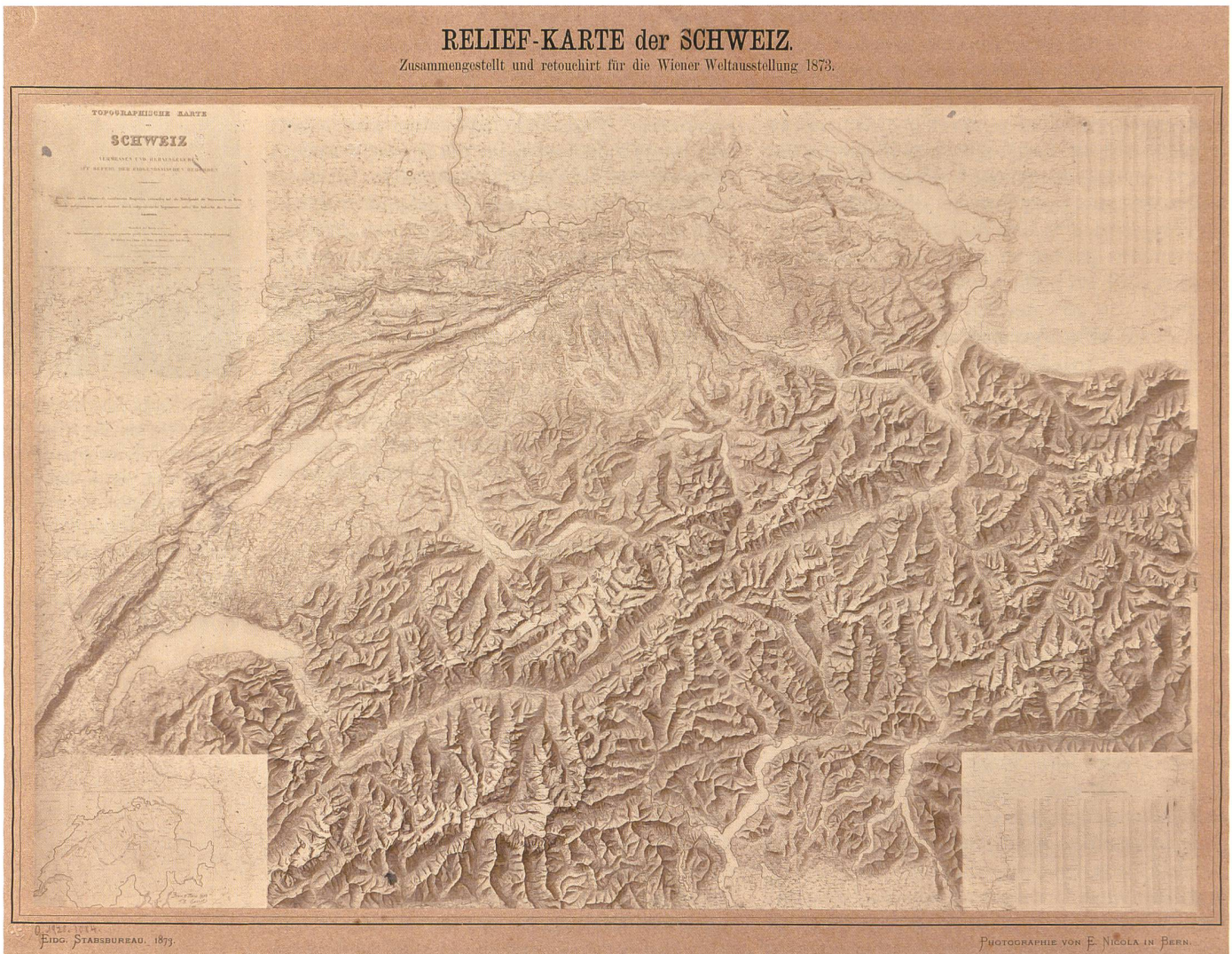
Abb. 4: Die Relief-Karte der Schweiz. Zusammengestellt und retouchiert für die Wiener Weltausstellung 1873 ist das erste photographische Produkt, das vom Eidgenössischen Stabsbureau in Zusammenarbeit mit dem Photographen Emil Nicola-Karlen veröffentlicht wurde. 48x33 cm, ca. 1:750 000, hier verkleinert auf ca. 35% (Schweizerische Nationalbibliothek, 1 Se 1873).

praktisch diese Methode ist, wurde eine solche Reduction vor meinen Augen von zwei gemeinen Soldaten in 11 Minuten vorgenommen. Die Zinco-photographie scheint einen bedeutenden Vortschritt in der Cartographie zu sein. Die Manoevert Karten werden gegenwärtig auf Guttapercha gedruckt (vide Muster). Der Versuch ist neu; was mir besser gefällt ist die belgische Methode i.e. direct auf präparirte Leinwand zu drucken.» 69 Henry James hatte bereits 1855, nach einer Reise nach Paris und nach entsprechenden Versuchen, die Photographie in die Kartenproduktion des Ordnance Survey eingeführt. 70 Gosset glaubte, an der Militärakademie von Woolwich in der Nähe von London etwas über die neuen Methoden erfahren zu können und bat Siegfried um einen Empfehlungsbrief an den dortigen Kommandanten sowie einen zweiten an denjenigen des Genie: «Letzter, Oberst Gosset ist mir nahe verwandt. Ohne Empfehlungsbrief wird er mich wahrscheinlich nach preussischer Art empfangen, das heisst, er wird sehr freundlich sein, mir aber gar nichts zeigen.» 71 Doch selbst wenn sein Verwandter gegenüber einem Familienmitglied schweigsam bleiben sollte, hatte sich die Bildungsreise für Gosset gelohnt: «Im Allgemeinen habe ich in den letzten Wochen mehr Neues gesehen und gelernt als ich er-