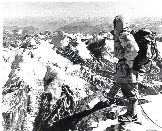
W.M. Conway, Climbing... in the Himalayas, New York 1894

Auktionen im Frühjahr und Herbst Kataloge auf Anfrage oder im Internet Angebote zur Auktion jederzeit erbeten