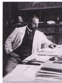
Abb. 103: Maurice Borel in seinem Neuenburger Atelier. Photographie von ca. 1905.

Seine grosse Leidenschaft blieb aber die Archäologie, die Suche nach den Überresten der Pfahlbauten entlang dem Ufer des Neuenburgersees, die vor allem dank der Juragewässerkorrektur (1868–1891) ans Tageslicht gekommen waren. 1907 wurde er Präsident der Ausgrabungskommission und kartierte laufend deren Funde bis zu seinem Tod im Jahre 1926.