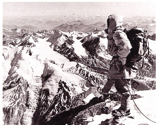
W.M. Conway, Climbing... in the Himalayas, New York 1894

Auktionen im Frühjahr und Herbst Kataloge auf Anfrage oder im Internet Angebote zur Auktion jederzeit erbeten