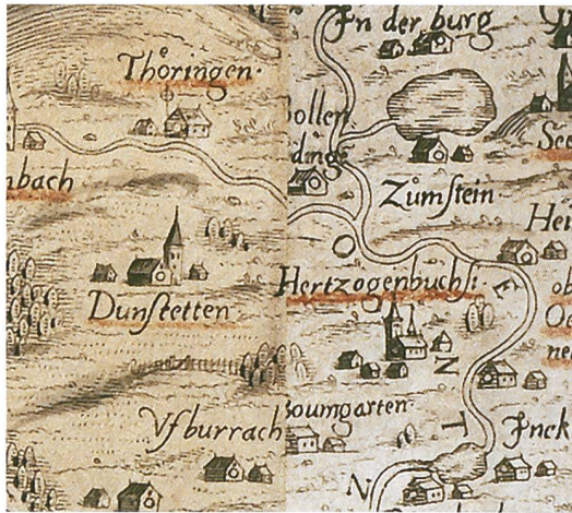
Abb.5: Passerproblem entlang der Nahtstelle der Blätter 8 und 9 (Universitätsbibliothek Bern, MUE Ryh 3211 : 15).