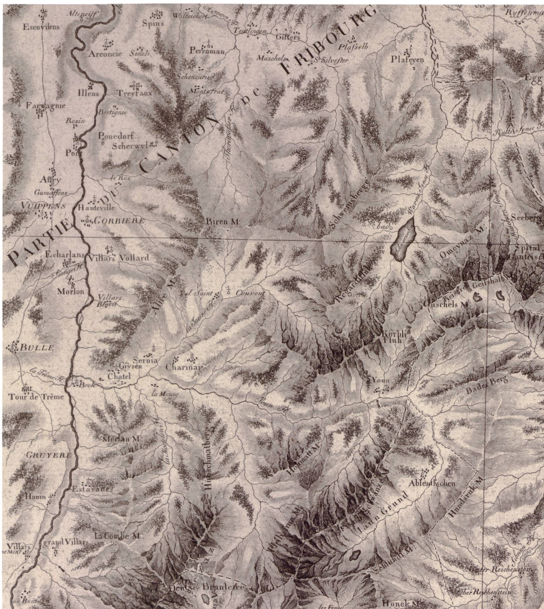
Abb. 1: Atlas Suisse , ca. 1:120 000, publiziert von Johann Rudolf Meyer in den Jahren 1796–1802. Zweifarbiges Kupferstich. Ausschnitt aus Blatt 10 auf ca. 80% verkleinert. Das Städtchen Greyerz scheint nicht bekannt zu sein und wird nur mit einem Kirchensymbol dargestellt, die Gastlosen werden Fisch Schwänze M[ont] genannt und die Dent de Branleire hat als damals höchster Gipfel des Kantons Freiburg noch keine Höhenangabe (ZBZH, Kart 500 10).

Mit dem Atlas Suisse , publiziert von 1796 bis 1802 durch Johann Rudolf Meyer (1739–1813) und erstellt von Johann Heinrich Weiss (1759–1826) und Joachim Eugen Müller (1752–1813), entstand aus privater Initiative eine ab 1786 völlig neu aufgenommene, einheitliche Karte ( Abb. 1 ). 2 Sie zeigt die Schweiz auf 16 Blättern im Massstab von ca. 1:120 000, wobei der Kanton Freiburg auf den Blättern No. 5, 6, 9 und 10 abgebildet ist ( Abb. 2 ). Die Vermessung beruhte auf frühen Basismessungen auf der Thuner Allmend sowie zwischen Suhr und Kölliken, von wo aus dann mit dem Sextanten Winkelmessungen und mit «Winkelscheiben» vorwiegend eine graphische Triangulation vollzogen wurde. Davon stammen zum Beispiel die beiden Höhenangaben für das Stockhorn und den Niesen sowie weiteren Gipfeln des Berner Oberlandes. Im Gegensatz zu anderen Kantonen finden sich auf Freiburger Gebiet (mit Ausnahme der Höhe des Neuenburgersees) noch keine Höhenkoten.