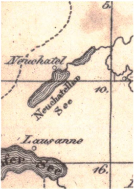
Abb. 4: Ausschnitt der Blatteinteilung des Topographisch-militairischer Atlas von der Schweiz im Massstab von ca. 1:160 000. Er entstand zwischen 1817 und 1824 in insgesamt 22 Blättern. Das Territorium des Kantons Freiburg ist auf den Blättern 5, 10 und 16 abgebildet (ETH-Bibliothek).

Abb. 3: Kartenausschnitt aus Section 10 im Originalmassstab. Einfarbiger Kupferstich. Die Topographie ist mit Böschungsschraffen nach der Theorie von Johann Georg Lehmann dargestellt, was im Gebirge anstelle von scharfen Graten zu gewöhnungsbedürftigen raupenförmigen Mustern führt (ETH-Bibliothek).