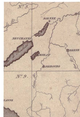
Abb. 2: Ausschnitt der Blatteinteilung des Atlas Suisse . Der Kanton Freiburg ist auf den Blättern No. 5, 6, 9 und 10 abgebildet (ZBZH, Kart 500 1a).