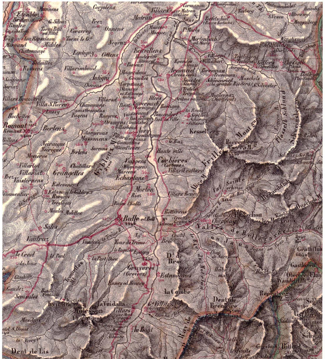
Abb. 6: Karte der Schweiz 1:200 000, publiziert 1835/36 von Joseph Edmund Woerl. 2-farbige Steingravur mit handgemaltem Grenzkolorit. Die Höhenangaben sind auf dieser Karte dichter, die Dent de Brenleire ist mit 7350' (franz. Fuss = 2387 m) als höchste Erhebung des Kantons Freiburg festgehalten. Der Vanil Noir scheint noch unbekannt zu sein, an seiner Stelle findet sich der Name Ray de Pezarnezza . Ausschnitt aus Blatt Freyburg in der Schweiz im Originalmassstab (Privatsammlung).

Die Karte der Schweiz 1:200 000, publiziert 1835/36 von Joseph Edmund Woerl (1803–1865) im Verlag Bartholomäus Herder, Freiburg i.Br., zeigt bereits eine eindrückliche dreidimensionale Geländedarstellung (Abb. 6). 6 Die angewendete Technik ist eine Mischung zwischen Böschungs- und Schattenschraffen, wobei die wurmartigen, weiss ausgesparten Bergkreten etwas unnatürlich erscheinen. Das Kartenwerk wurde zweifarbig in Stein graviert und die Kantonsgrenzen nach erfolgtem Druck von Hand koloriert. Die Ortschaften und das Strassennetz sind rot dargestellt. Eine grosse Zahl von Orts-, Flur- und Gebäudenamen sollte den Reisenden die genauere Identifikation des Standpunktes vor Ort zusätzlich erleichtern. Bei den grösseren Ortschaften ist weiter die Zahl der Einwohner und die Höhe über Meer in Fuss angegeben, wobei diese Informationen wahrscheinlich nur schwierig zu erheben und entsprechend fehlerhaft waren. Der Kanton Freiburg ist auf den Blättern Bern (1834) und Freyburg in der Schweiz (1835) abgebildet.