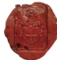
Abb. 9: Siegel auf einem Briefcouvert, adressiert an «Monsieur le Commissaire Général Crausaz du Canton de Fribourg», mit zwei Poststempeln «CAROUGE 24 FEVR 55, 8 M» und «GENEVE 24 FEVR 55, 10 M». Dieses sog. Tarnawa-Wappen ist dasjenige zahlreicher polnischer Adelsfamilien, darunter auch der Stryieński (StAF, Carte Stryieński 14).