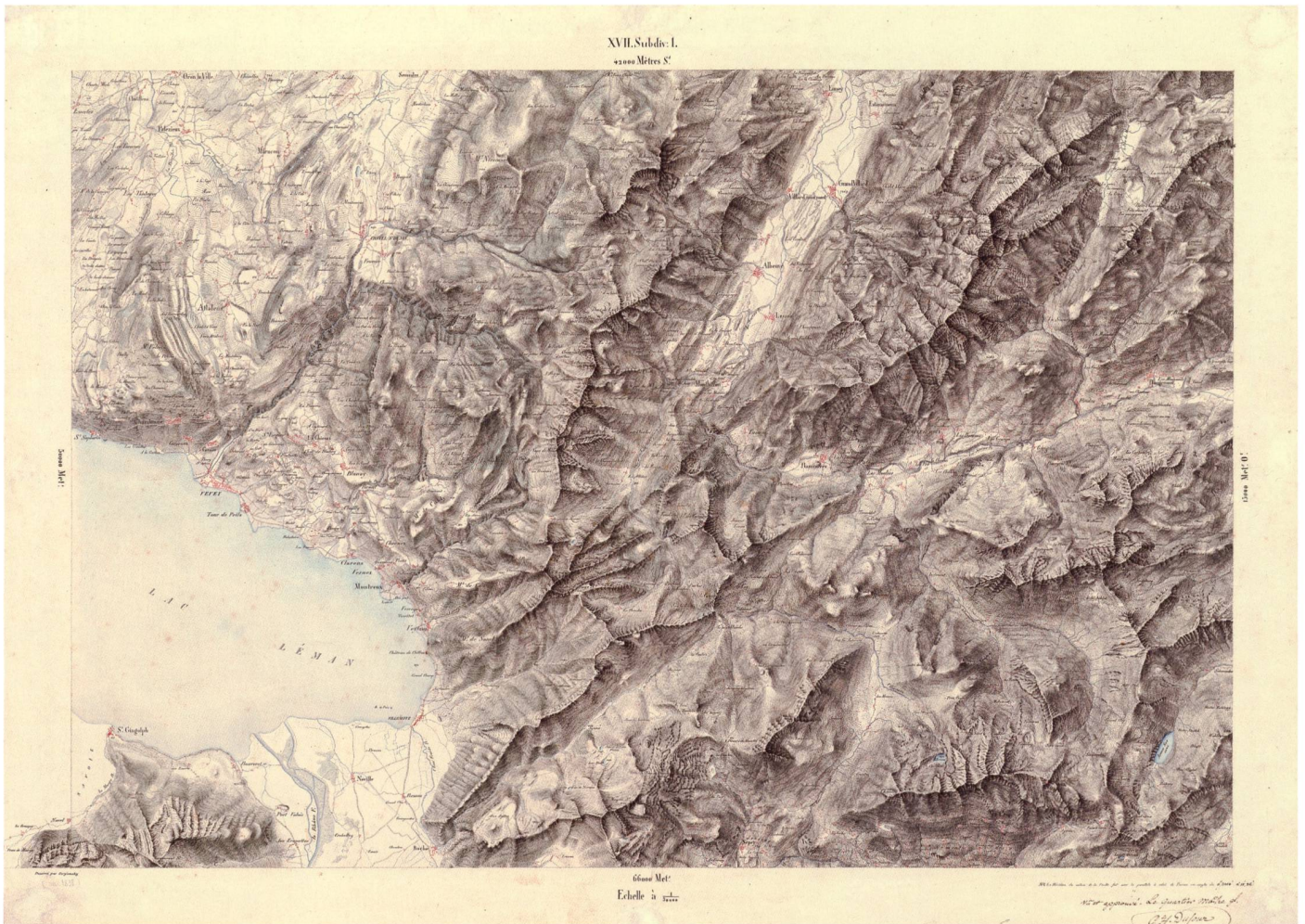
Abb. 13: Musterzeichnung für die Dufourkarte, Blatt XVII. Subdivision 1 im Massstab 1:50 000, um 1841. Farbige Tuschezeichnung von Stryieński, Format: 70 x 48 cm. Mit diesem Versuch wollte Dufour die Wirkung der angestrebten Felsdarstellung und der Schattenschraffen testen. Vielleicht diente diese Musterzeichnung auch als Vorlage für den Kupferstecher (swisstopo Kartensammlung, TKZ Studien 17 1).