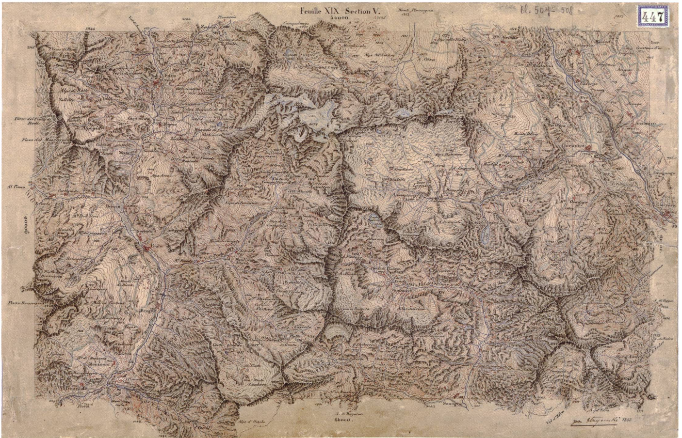
Abb. 70: Originalaufnahme Peccia 1:50 000 des Kantons Tessin von Stryieński für das Blatt XIX Bellinzona-Chiavenna der Dufourkarte (507, mit Teil-Bl. 508 Biasca). Originalzeichnung 1853, Format 76 x 48 cm (swisstopo Kartensammlung, OA 447 1853).