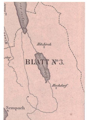
Abb. 74: Ausschnitt aus der Blattübersicht der Topographischen Karte des Kantons Luzern (ZBZ, LU 5 Ji 76 1 4 Blatt 4).