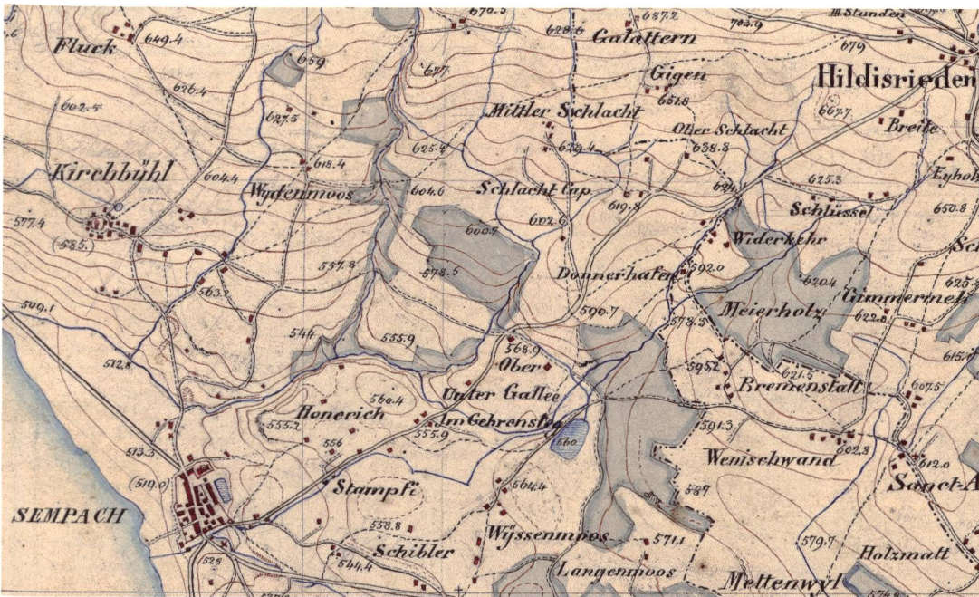
Abb. 73: Ausschnitt des Gebietes zwischen Sempachersee und Baldeggersee aus der Originalaufnahme 1:25 000 für Blatt VIII Aarau-Luzern Zug-Zürich der Dufourkarte. Aufgenommen und reingezeichnet von Stryieński (swisstopo Kartensammlung, OA 122 1854).