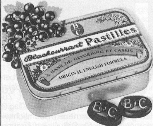
Das Original: Nur in Apotheken und Drogerien.

Für eine schmiegsame Kehle und eine reine Stimme.