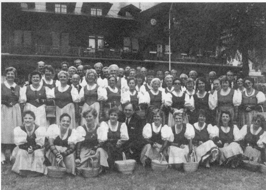
Les Chœurs de Chailly-sur-Clarens