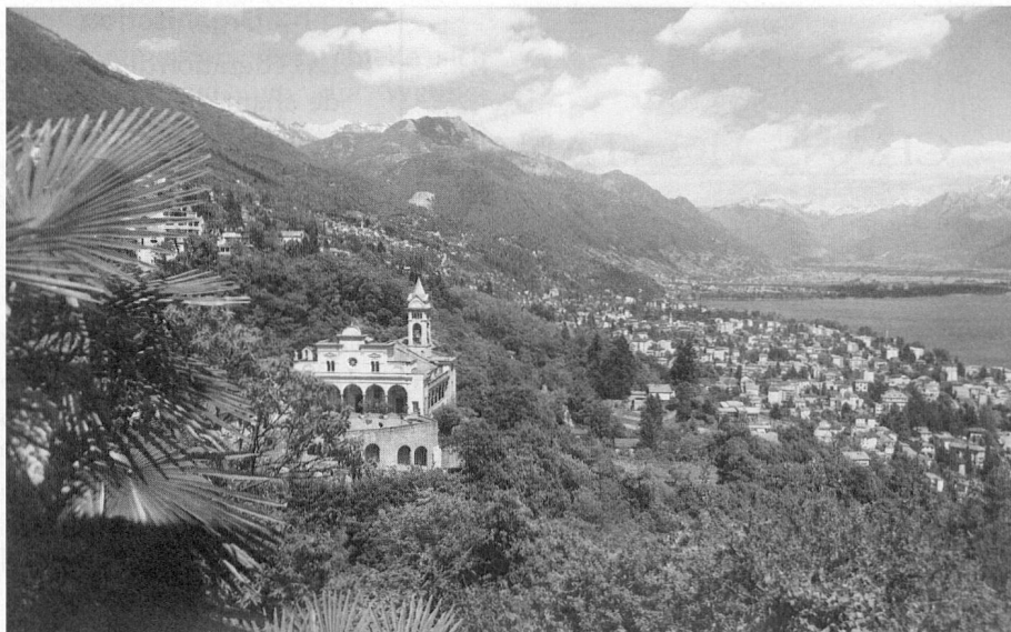
Locarno - im Sonnenland Ticino, mit Blick auf die Kirche Madonna del Sasso und den See

Der geschäftliche und gesellschaftliche Mittelpunkt der Stadt ist die Piazza Grande, wo jedes Jahr im Sommer die internationalen Filmfestspiele stattfinden und wo auch andere Veranstaltungen – vom Flohmarkt bis zum Open-air-Konzert – inszeniert werden.