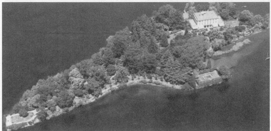
L'Île de Brissago

Ensuite, les participants auront tout le loisir de passer de bons moments ensemble et d'avoir des conversations animées.