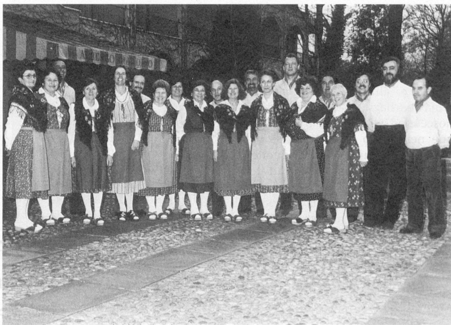
La Voce Asconese davanti all' Albergo Giardino