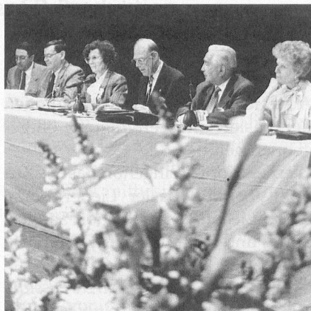
L'ancien Comité directeur