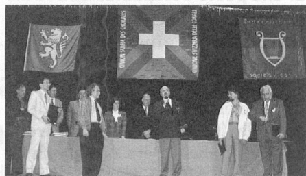
I nuovi Membri onorati dell'USC