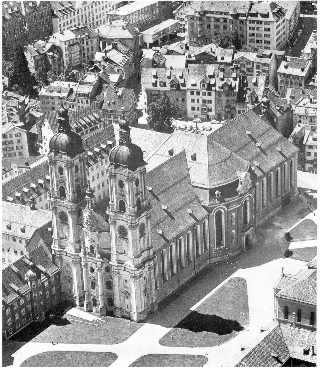
La cathédrale de style baroque de St-Gall

Communications importantes sur la 8 e revision AVS/AI