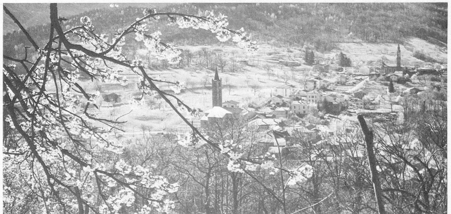
Printemps sur les villages de Sala et Vaglio.

Le but de ces remarques était de dégager certaines constantes et les limites d'une situation culturelle; elles ont, par conséquent, quelques lacunes sur le plan de l'information, des lacunes d'ailleurs inévitables lorsqu'on essaie de rendre compte d'une matière vivante qui est encore en formation.