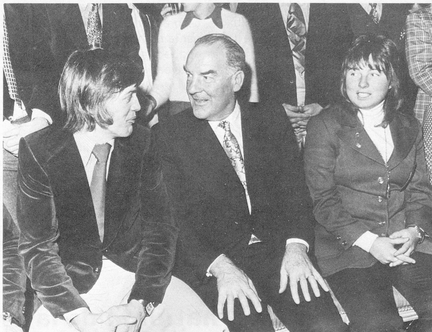
Le conseiller fédéral M. Gnägi a reçu au début décembre nos héros sportifs. On le reconnaît entouré de M.-T. Nadig et de B. Russi.

L'accord de libre-échange avec la CEE est accepté par tous les can-