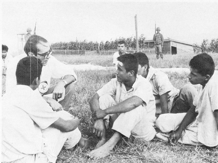
Visite d'un camp en Amérique latine.

Organisation neutre, privée et suisse, le CICR est chargé de veiller à l'application par les Etats signataires des Conventions de Genève dont il est le promoteur. En outre, il est particulièrement désigné, en raison même de sa neutralité, pour intervenir auprès des belligérants en faveur des victimes des conflits. Quelles sont-elles? Il s'agit tout d'abord des militaires blessés, des prisonniers de guerre aux mains de l'ennemi, pour lesquels le CICR, s'efforce, de la capture à la libération, d'améliorer