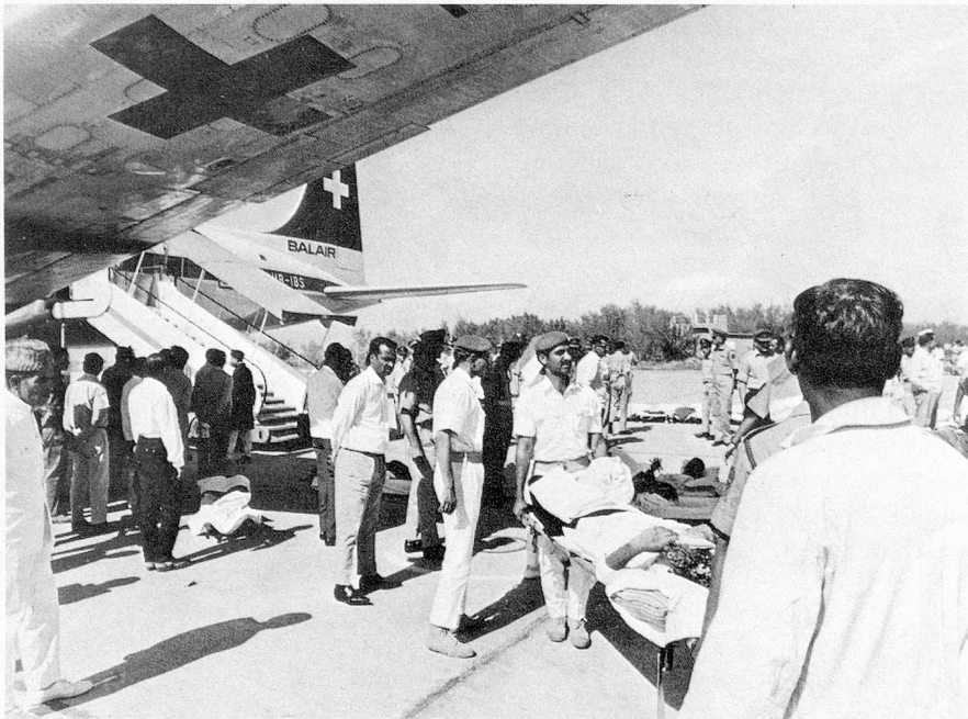
Rapatriment de prisonniers pakistanais depuis l'Inde.