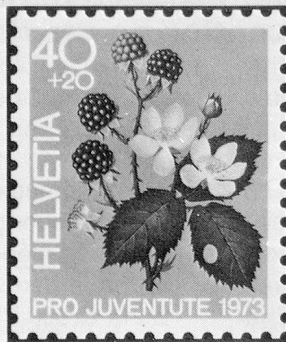
Brombeere Mûre sauvage Mora