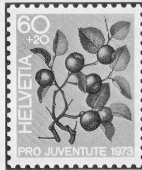
Heidelbeere Myrtille Mirtillo