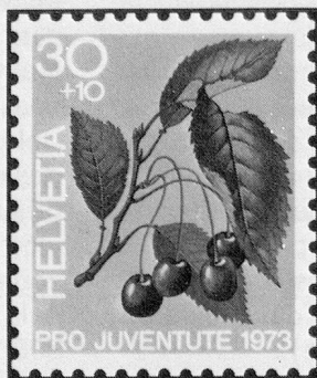
Süsskirsche Merise Ciliegia