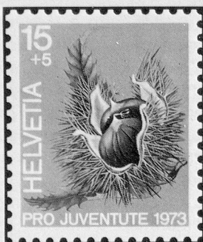
Edelkastanie Châtaigne Castagna

Früchte des Waldes Fruits de la forêt Frutti del bosco