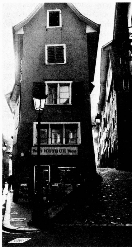
In der Altstadt von Baden (SVZ)

Diese Bescheidung in die eine ge- schenkte Feder ist für uns Aar- gauer typisch. Das pars pro toto Gesetz ist uns eingeboren. Es gibt uns Spielraum, die Freiheit des Verzichts. Und eine andere Frei- heit gibt es nicht. Von daher stammt vielleicht auch unsere Ver- haltenheit, der melancholische Grundton unseres Charakters, der in jedem Kunstwerk, sei es ein Gedicht, sei es ein Bild oder ein Musikstück, aufklingt. Es ist aller- dings gefährlich, so verallgemei- nernd von «uns» und «unserem Charakter» zu sprechen, um so ge- fährlicher, als der Kanton Aargau hie und da mit der Etikette «Mini- turschweiz» versehen wird, nicht nur von Linguisten, Geographen und Soziologen, sondern auch von Politikern, ist doch das Abstim- mungsergebnis des Kantons Aar- gau normalerweise das getreue Spiegelbild des eidgenössischen. Und doch stimmt es, dass gewisse Charakterzüge allen Aargauern gemeinsam sind. Der Aargauer hat kein eigentliches Zentrum. Es fehlt ihm Paris, um seine Mode danach zu richten, er kennt kein Mekka für seine täglichen Gebete. Er begnügt sich mit seiner näch- sten Umgebung: