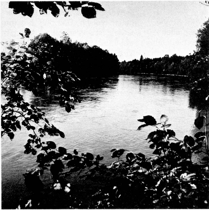
Die «Reuss» bei Unterlunkhofen