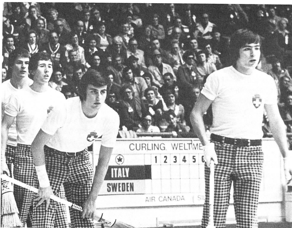
Die Mannschaft des Curling Club Dübendorf gewann die Bronzemedaille an den Curling-Weltmeisterschaften.

Die Schweiz erringt die Bronzemedaille an den Curling-Weltmeisterschaften, die in Bern durchgeführt worden sind.