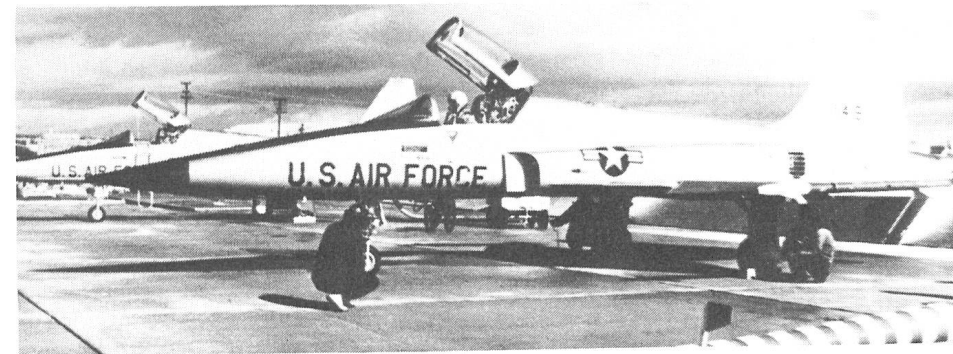
Der F-5 E Tiger II.

Die Schweizerische Zentrale für Handelsförderung und die Handels- und Industriekammer der UdSSR unterzeichnen in Bern ein Abkommen betreffend die Zusammenarbeit dieser beiden Organisationen.