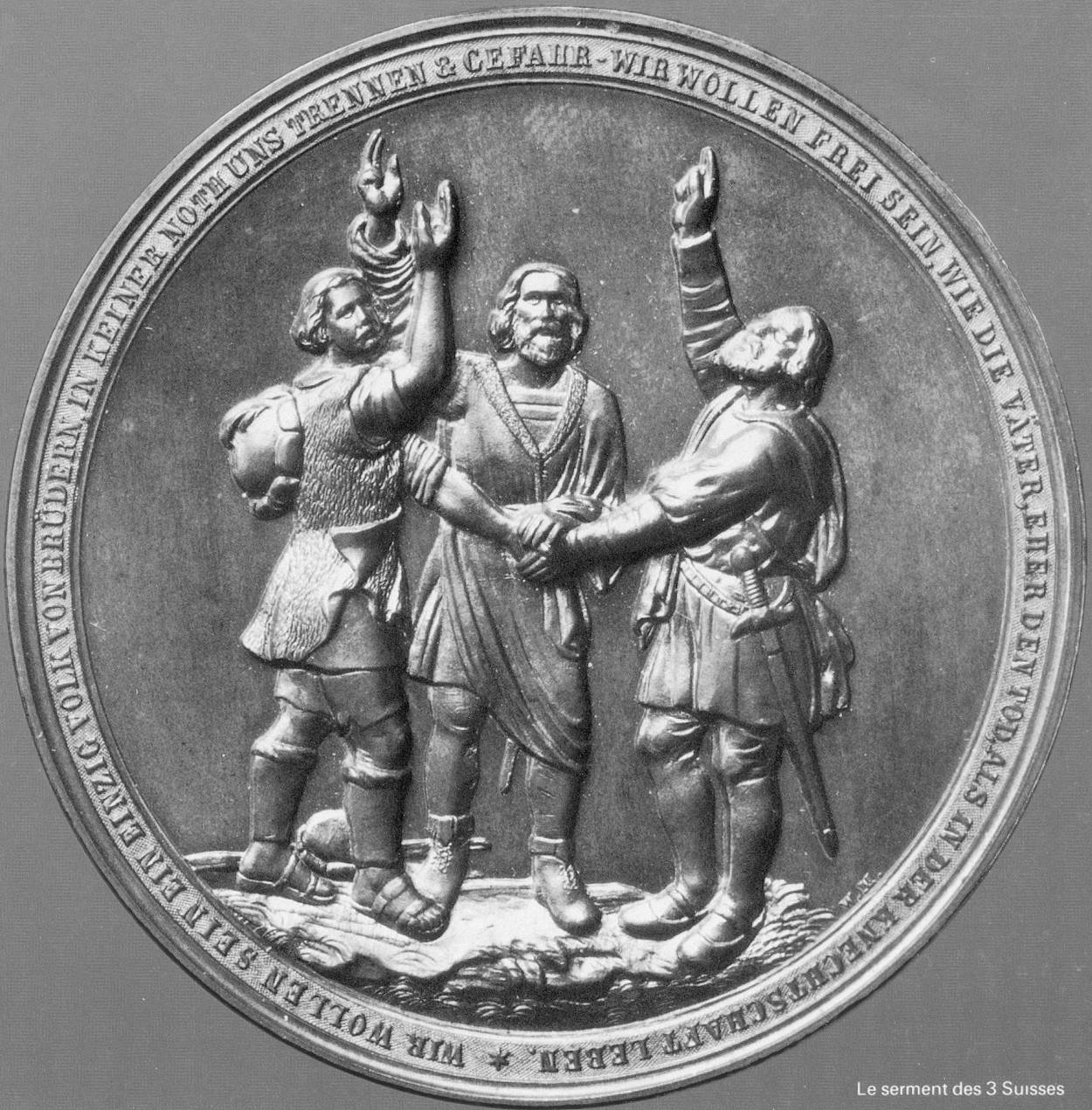
Le serment des 3 Suisses