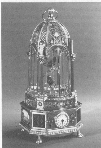
Horloge à automates, vers 1820

métal, l'impression des tissus, le filage, le tissage, la poterie, etc. Il importe avant tout que ces enfants, qui seront les visiteurs de demain, puissent établir un lien étroit avec les biens culturels dignes d'être conservés. Par ailleurs, le musée est toujours disposé à répondre aux demandes de renseignements. Chaque jour, de nombreuses questions personnelles ou écrites affluent chez les spécialistes; certaines concernent des pièces de collections du musée, d'autres – et c'est la grande majorité – des objets que le public voudrait soumettre à un examen approfondi. Les fonctionnaires répondent volontiers à toutes ces questions, pour autant qu'elles se limitent à des estimations d'âge ou d'origine, car toute indication de valeur leur est interdite. Parmi les nombreuses ressources à disposition, citons la bibliothèque richement dotée d'ouvrages spécialisés, la photothèque, ainsi que les collections d'étude aménagées selon les principes les plus modernes et accessibles aux spécialistes qualifiés, sur demande préalable.