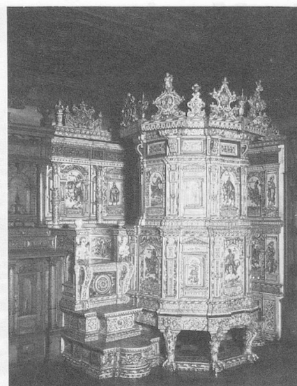
Poêle de Ludwig Pfau de Winterthur, 1620

Au début de chaque année a lieu une exposition de tous les objets qui ont été donnés ou prêtés au musée au cours de l'année précédente. Les donateurs sont invités à cette manifestation, ce qui permet d'établir des contacts personnels. La Société pour le Musée national, qui regroupe les amateurs d'art et d'antiquités de toute la Suisse, particulièrement liés au Musée national, fait partie des bienfaiteurs les plus actifs de celui-ci. L'Association des musées suisses a installé son secrétariat dans des locaux que le musée a mis à sa disposition; environ 250 musées de toutes catégories, jusqu'aux plus petits musées locaux, sont rattachés à cette association. Avec le Musée des transports et des communications, à Lucerne, le Musée national constitue le plus grand musée (en surface) et la