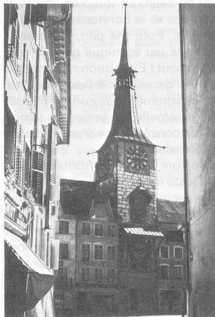
La Tour de l'Horloge à Soleure

et de ses hôtes. C'est devant la majestueuse église de Saint-Ursus, à proximité du si typique Hôtel de la Couronne que Wilhelm Lehmann, poète lyrique allemand, a conçu ses admirables vers, chantant l'union du présent et du passé. Et Gotthelf, Spitteler, Romain Rolland et Josef Reinhart ne se sont jamais lassés de chercher ce que la petite ville pouvait avoir de précieux et de le faire connaître à leurs lecteurs. Les peintres suivirent le cours du Verenenbach, à la recherche de l'Ermitage et du Wengistein.