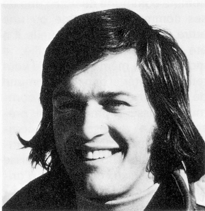
◀ Bernhard Russi, une deuxième place méritée dans la descente à ski.