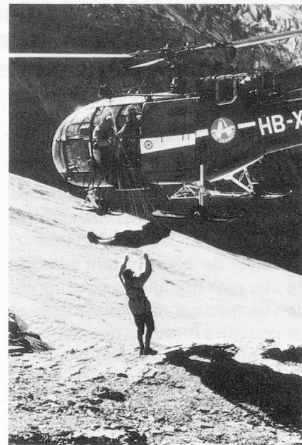
Sauvetage en haute montagne, chargement à bord d'un hélicoptère Alouette III au moyen d'un filet.

ler, médecin, aujourd'hui président, alors chef technique, procéda à la réorganisation de la GASS et à sa scission intégrale d'avec la Société suisse de sauvetage. On érigea en même temps, selon des critères topographiques et météorologiques, une organisation embrassant toute la Suisse. Ce n'est que plus tard que l'on procéda à une décentralisation du matériel de sauvetage en répartissant celui-ci sur différents dépôts de base dans les aérodromes de Zurich-Kloten, Mollis, Samedan, Magadino, Zermatt, Sion, Berne, Colombier, Genève, Interlaken et Bâle.