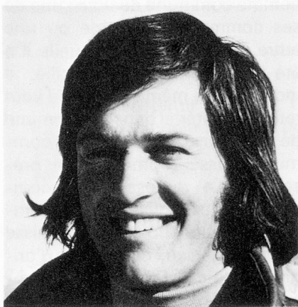
◀ Bernhard Russi, une deuxième place méritée dans la descente à ski.