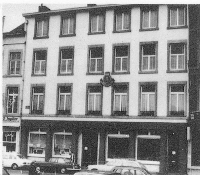
Le « Foyer » de l'Armée du Salut. 87 rue Grétry à Liège. 45 lits. Institution pour hommes.