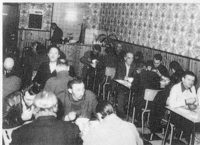
Une partie du restaurant

Un nouveau Comité d'Honneur est en voie de formation pour appuyer un nouvel appel à la population liégeoise et les demandes de subsides à présenter à certaines Autorités. Les personnalités suivantes ont bien voulu accepter d'en faire partie (d'autres réponses sont attendues) :