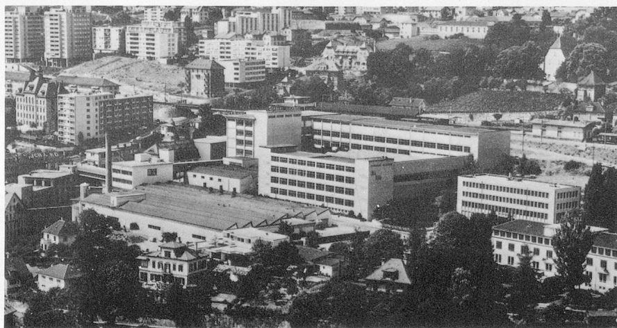
Vue générale des fabriques de Chocolat Suchard S.A., Neuchâtel

Fondée en 1826 par Philippe Suchard, pionnier de l'industrie chocolatière, cette importante entreprise neuchâteloise est passée rapidement du stade artisanal au niveau industriel.