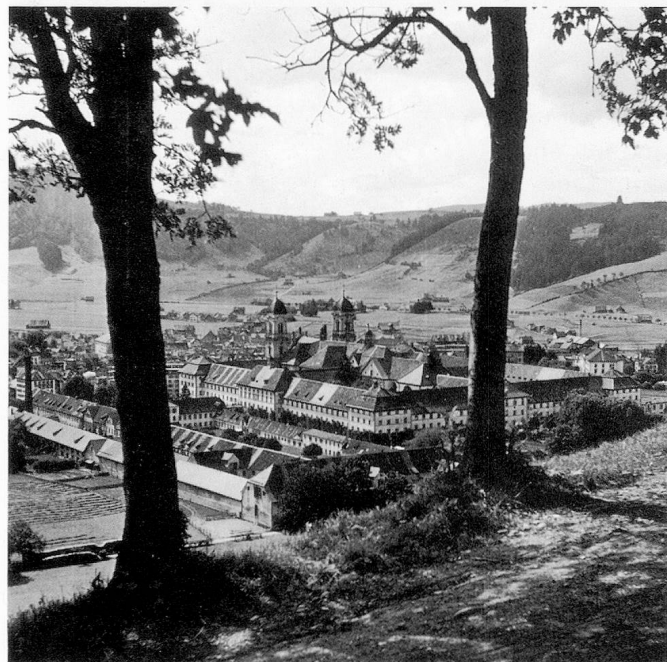
Vue du couvent bénédictin d'Einsiedeln, construit en 1720–1726 par Caspar Mossbrugger (ONST)