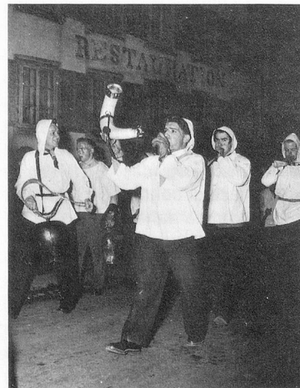
«Klausjagen», une vieille coutume de la Saint-Nicolas à Küssnacht