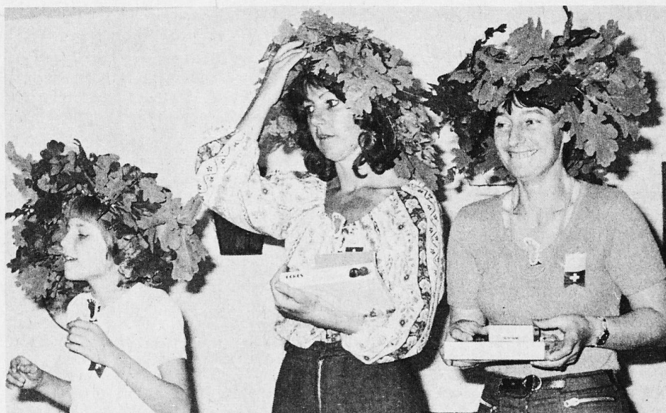
Fussgänger-Rallye 1976 des Schweizervereins „Helvetia“ in Hamburg. Unser Bild zeigt die drei Preisträger des goldenen, silbernen und bronzenen Fusses.

Eine kurze Analyse zeigt, dass kulturelle Veranstaltungen, die das Fernsehen ebenfalls bringt oder doch bringen könnte, nicht honoriert werden. Aber auch persönliches Engagement, wie es bei der Fussgänger-Rallye, dem Schiessen um den Wanderpreis oder beim Fasching gefordert wurde, steht nicht sehr hoch im Kurs der Gunst. Allenfalls herausragende Ereignisse, wie das nur alle vier Jahre stattfindende Fest der Nationen oder der Besuch der Lufthansa-Werft mit einem Einblick in die Technik der zivilen Luftfahrt vermögen überdurchschnittliche Beteiligungen hervorzurufen. Auffällig aber ist die Beteiligung beim Fondue-Essen, die noch höher ausgefallen wäre, würde nicht eine Platzrestriktion vorhanden gewesen sein. Der sich aus der Kurzanalyse ergebende Spiegel zeichnet eigentlich nicht die vielzitierte Vereinsmüdigkeit, son-