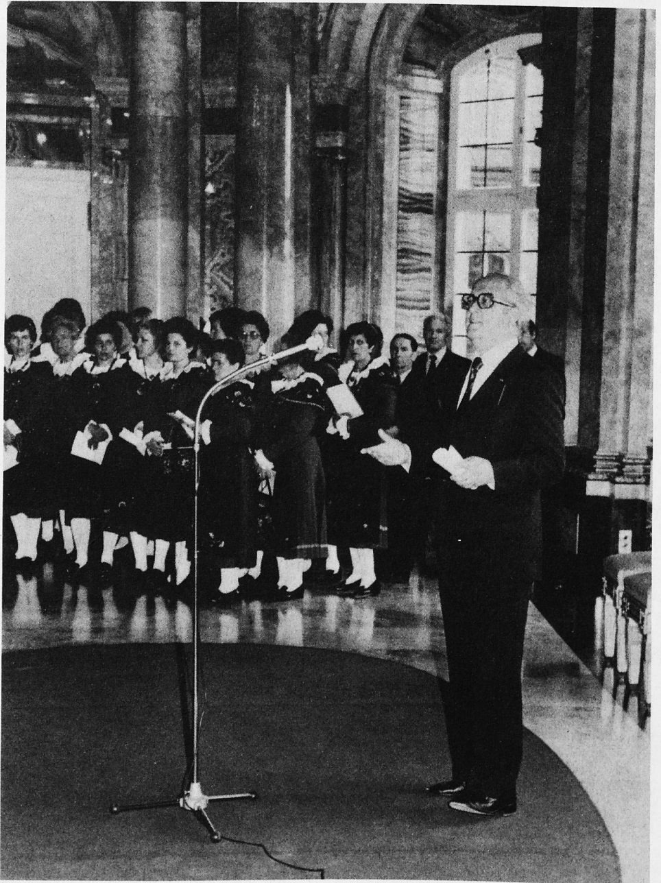
Die Landesregierung von Baden-Württemberg gab zur Hundertjahrfeier der «Schweizer Gesellschaft Stuttgart» im Neuen Schloß zu Stuttgart einen Staatsempfang. Innenminister Karl Schiess richtete einige Worte an die Gäste und betonte, die Schweizer Gesellschaft sei einer der ältesten und angesehensten Vereine der Landeshauptstadt. Unser Bild zeigt den baden-württembergischen Innenminister. Im Hintergrund der Chor Rumantsch San Murezzan-Schlarigna-Champfer der mit Engadiner Weisen aufwartete.

hervor und kündigte einen Besuch der baden-württembergischen Landesregierung im Kanton Thurgau an, der demnächst stattfinden soll. — Alphornbläser und ein Engadiner Chor umrahmten den festlichen Akt mit frohen Klängen aus den heimatlichen Bergen. — pp