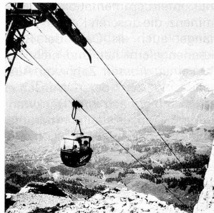
Blick auf das Diablerets-Massiv